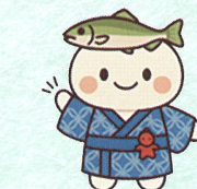
岐阜産保公式キャラクター 「ぎさんぼさん♪」